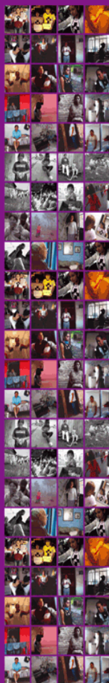
Imágenes del Concurso de Reportaje Fotográfico "Historias de Mujeres Mexicanas"

Agradecemos a la Fundación Ford y a Sigrid Rausing Trust el apoyo para la realización del Diplomado